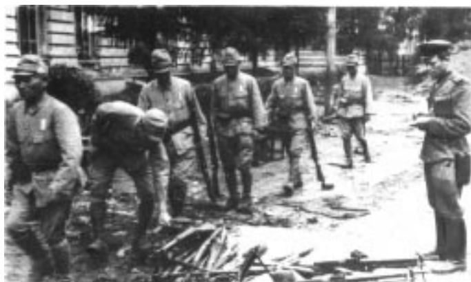
Сдача оружия пленными японцами

28 августа полное освобождение Сахалина.